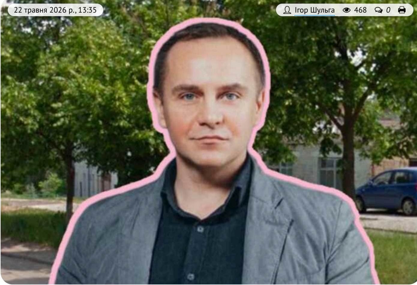
Судова війна за забудову Деміївської: що відомо про справу «КФ Марлеан»

ТОВ «КФ Марлеан» в судовому порядку намагається добитися видачі містобудівних умов та обмежень (МУО) на проєктування реконструкції будівель на вул. Деміївській, 5 під багатифункціональний комплекс (БФК). Наприкінці 2025 року Департамент містобудування та архітектури КМДА відмовив компанії у такому погодженні – через те, що більша частина відповідної ділянки знаходиться в межах комунально-складської території і що ця земля входить до Центрального історичного ареалу, що зумовлює низку обмежень стосовно її забудови. Забудовник виграв перший раунд цього судового спору, однак столична мерія теоретично має шанс «відігратися» у апеляційній інстанції. З огляду на тотальну неоформленість в Києві документації щодо меж та режимів використання історичних ареалів Києва, шансів це дуже не багато.