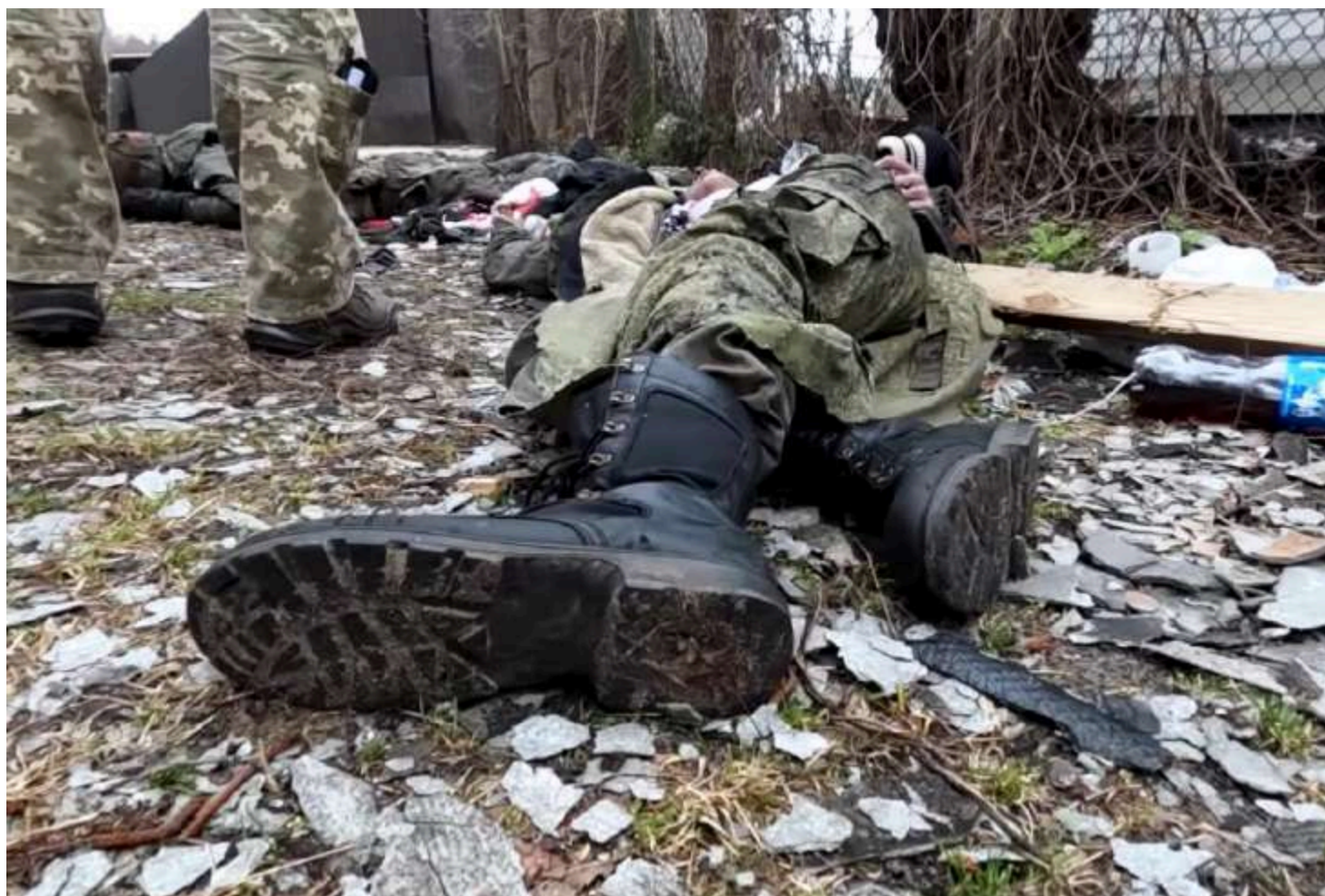
Ілюстративне фото з відкритих джерел

Міністр оборони України Михайло Федоров заявив, що стратегічним завданням України є збільшення втрат російської армії до 200 військових на кожен квадратний кілометр просування окупантів.