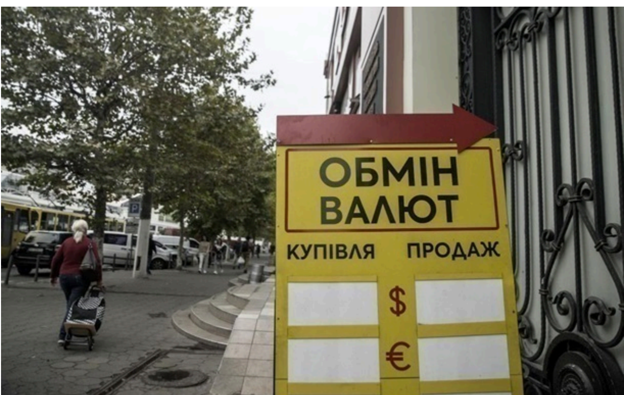
Обмінники купують долар у середньому по 44,00 гривні

Середній курс продажу долара залишився на рівні 44,00 гривні, а курс продажу євро впав до 51,60 гривень.