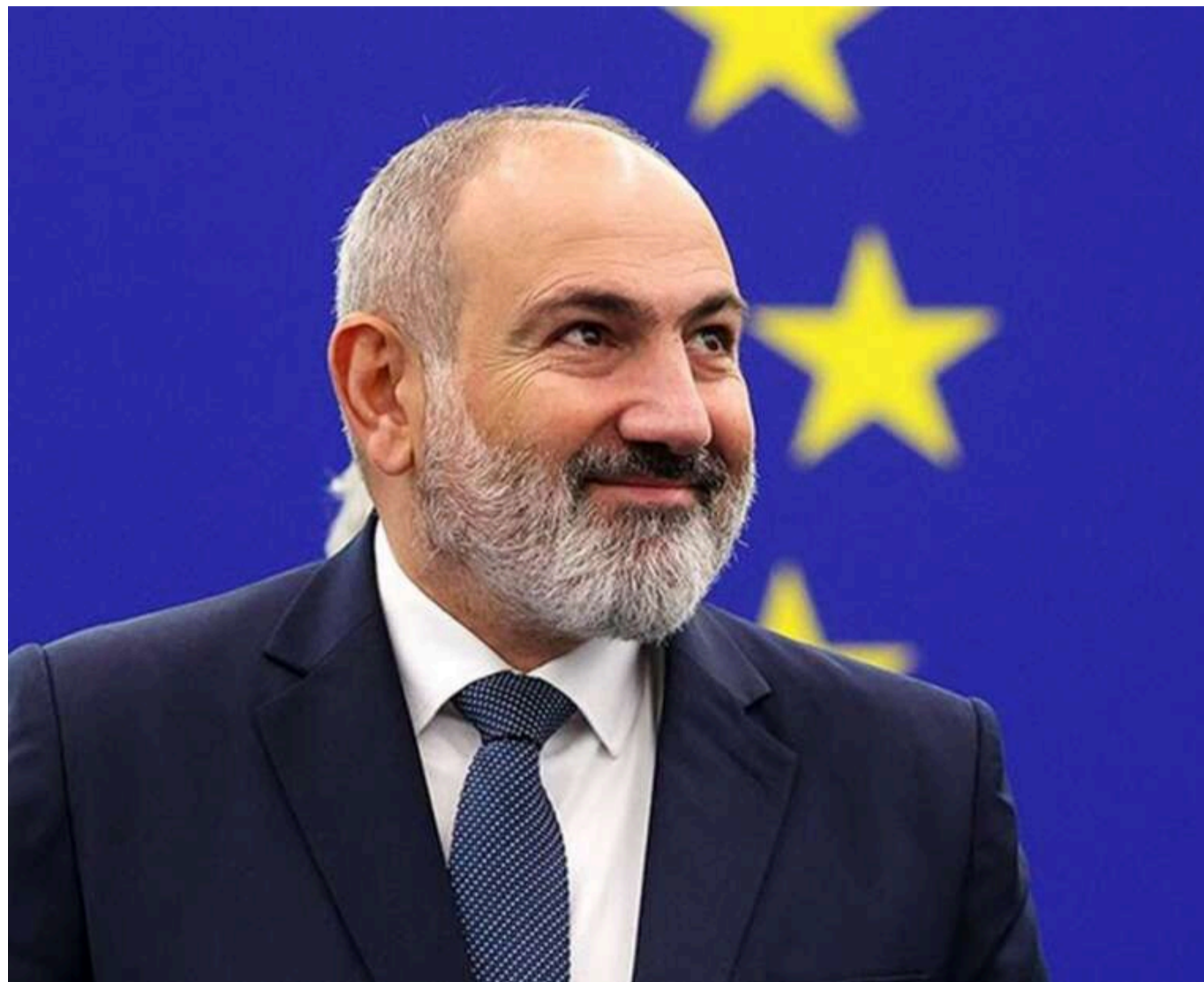
Вірменія та РФ мають чіткі домовленості щодо вартості газу, - Пашинян

Пашинян заявив про «стратегічну домовленість» з Росією щодо ціни на газ.