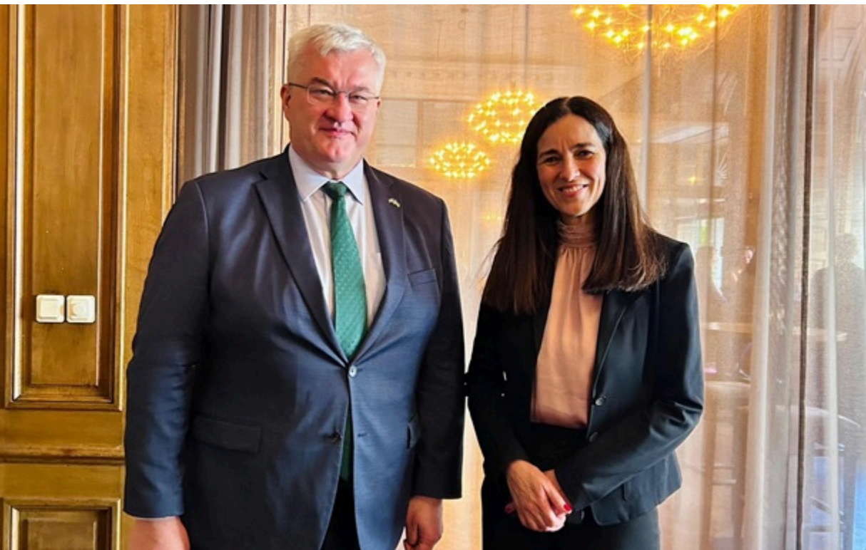
Андрій Сибіга і Анета Орбан під час зустрічі у Гельсінгборзі

Андрій Сибіга та Анета Орбан скоординували подальші двосторонні контакти на всіх рівнях. Другий раунд консультацій відбудеться наступного тижня.