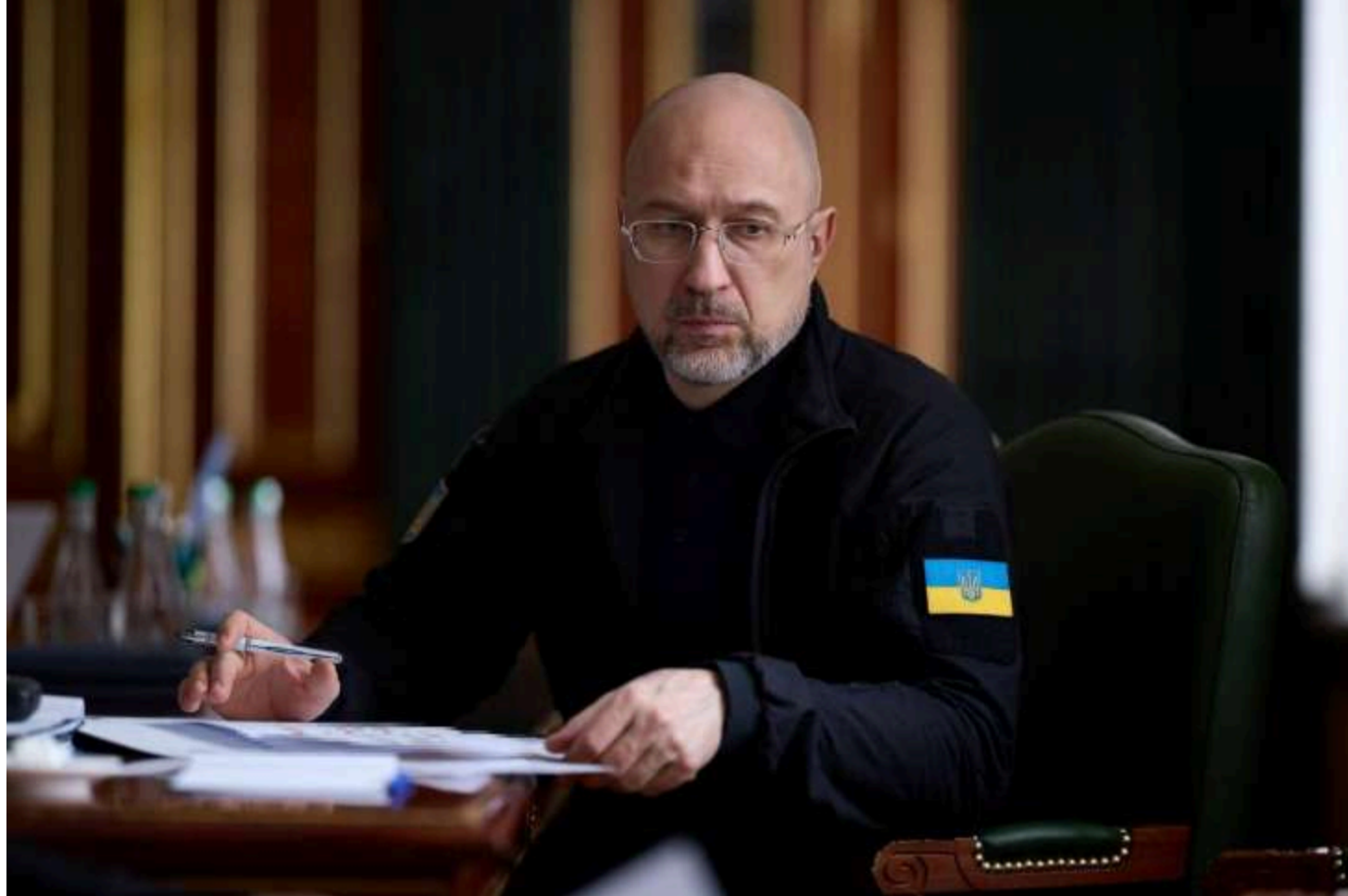
Денис Шмигаль

Міністр енергетики України Денис Шмигаль вважає, що працівникам Чорнобильської АЕС потрібно підвищити зарплату.