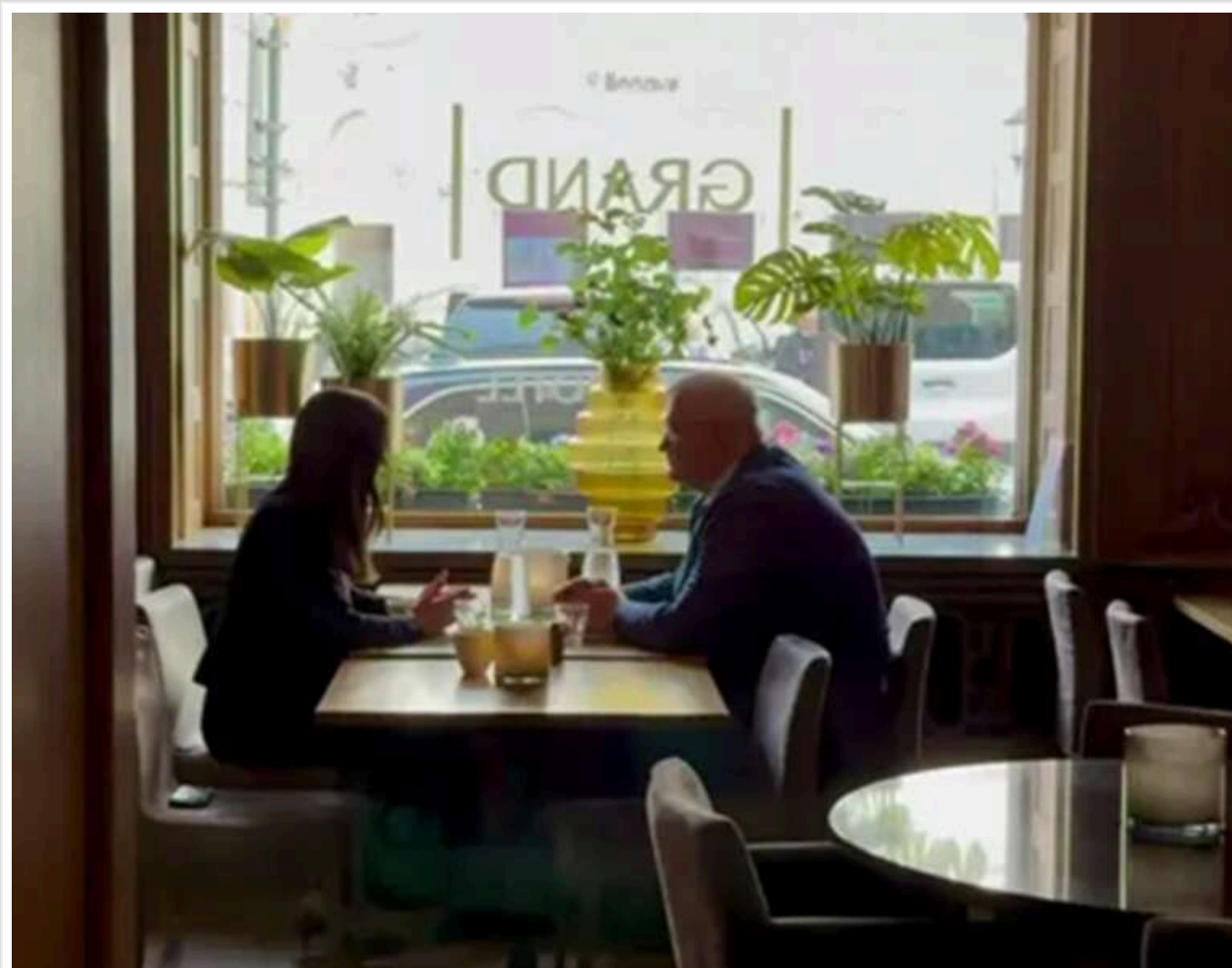
Нацменшини та євроінтеграція: Андрій Сибіга провів першу зустріч із новою главою МЗС Угорщини

Андрій Сибіга провів першу особисту зустріч із Анітою Орбан, очільницею МЗС Угорщини.