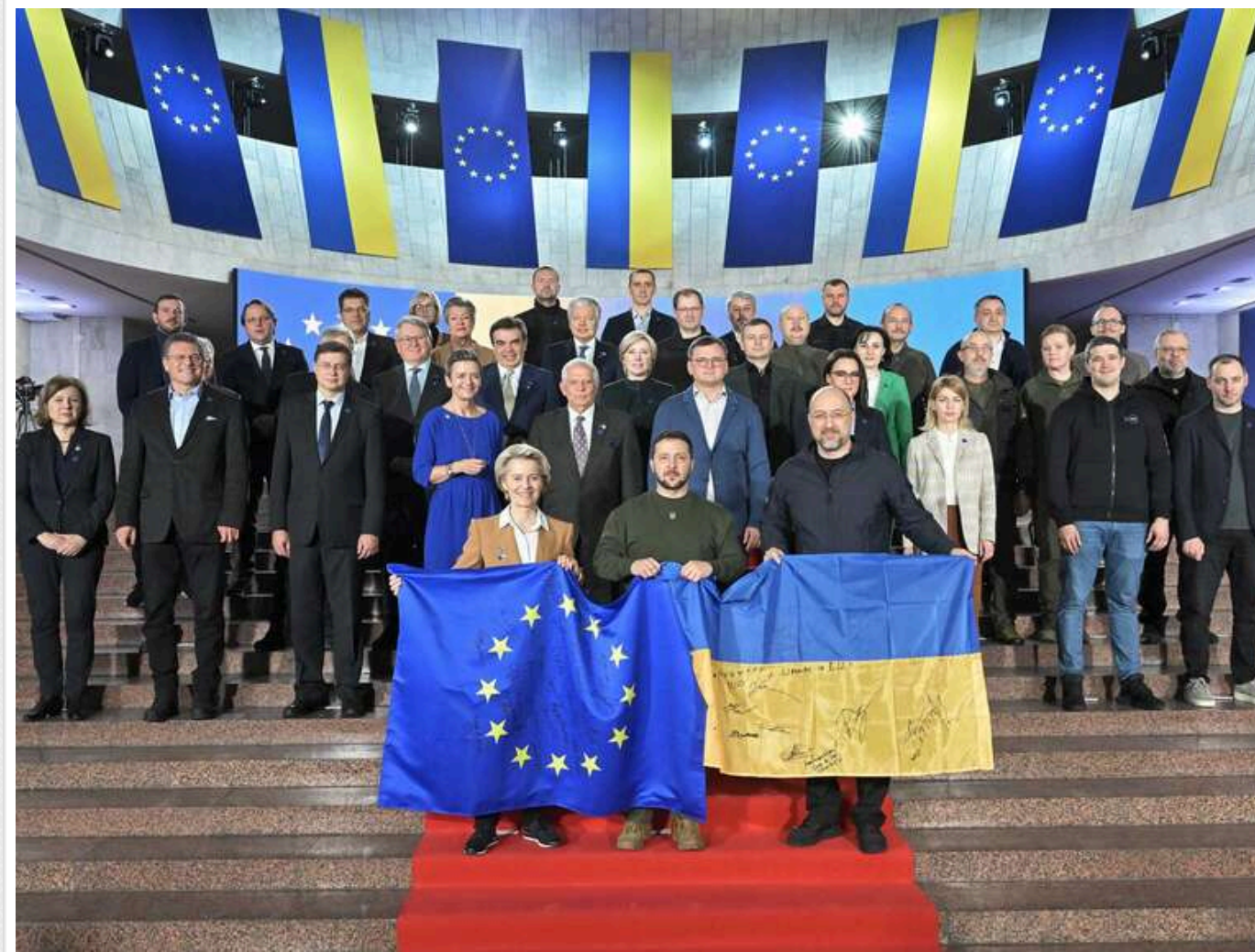
Ультиматум щодо членства в ЄС: лідери Європи тиснуть на Зеленського через корупційні розслідування

Європейські лідери посилюють тиск на Зеленського, фактично підтримуючи розслідування НАБУ проти його найближчого оточення.