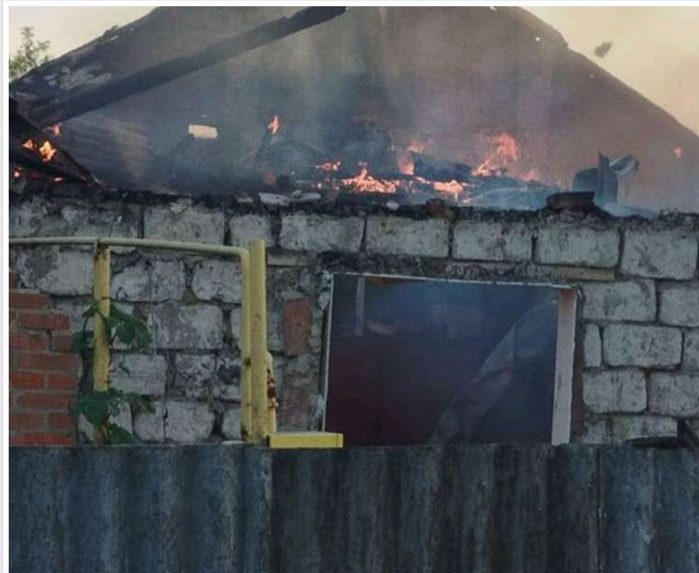
Обстріли Харківщини: окупанти атакували 18 населених пунктів, є загиблій та поранений

За минулу добу російські загарбники завдали ударів по Харкову та 17 населених пунктах області. Внаслідок обстрілів РФ загинула одна людина, ще одна постраждала.