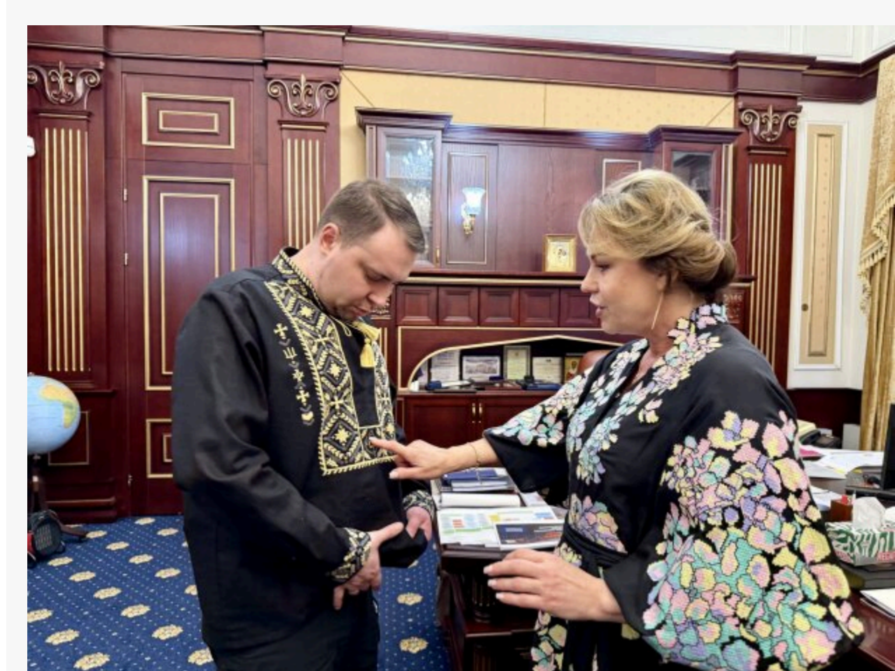
Кирило Буданов та Алла Гордієнко

Те, що ще вчора здавалося лише дитячою мрією, стало реальністю. Очільник Офісу Президента України Кирило Буданов зустрів день у новій особливій сорочці.