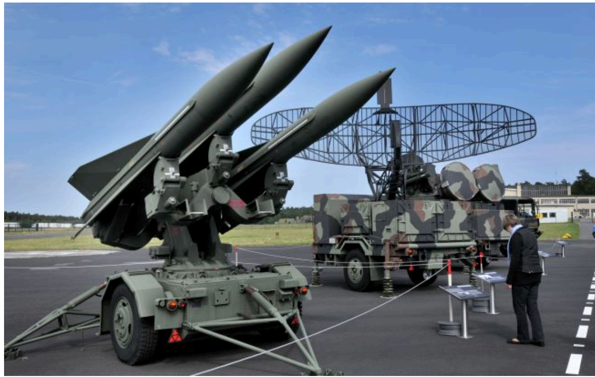
Фото: ЗРК HAWK (Getty Images)