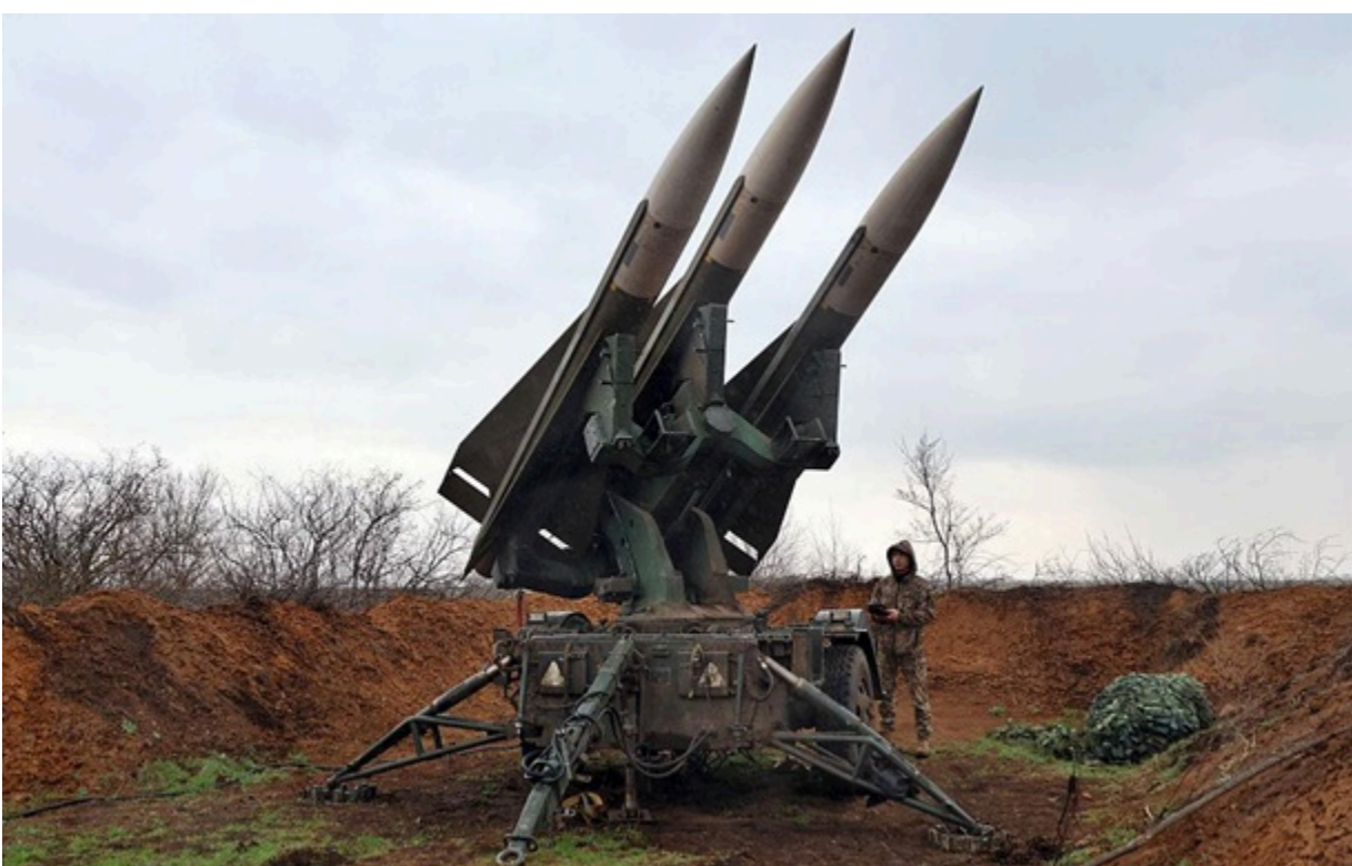
Вартість угоди складе більш ніж 108 мільйонів доларів

Держдеп прийняв рішення схвалити можливий продаж уряду України послуг з підтримки у боєздатному стані ЗРК HAWK.