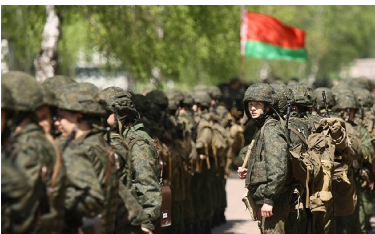
Росія в межах навчань уже доставила ядерні боєприпаси до польових пунктів зберігання на території Білорусі

Лукашенко заявив про готовність приїхати в Україну. Загроза з Білорусі: Зеленський прибув у Славутич. Кореспондент.net виділяє головні події вчорашнього дня.