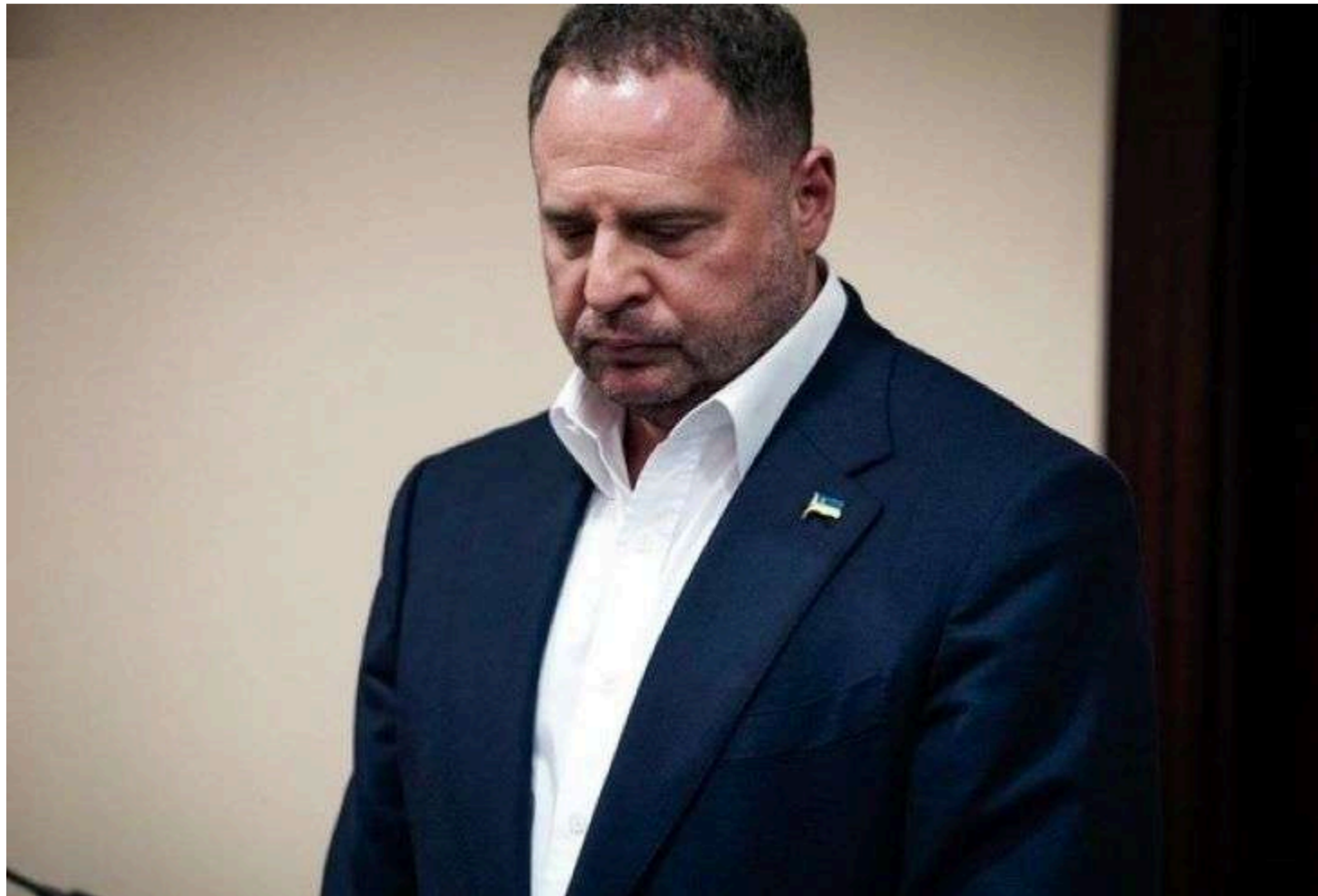
Фото: Андрій Єрмак/Андрій Ходьков/Апостроф

Апеляційна палата Вищого Стокорупційного суду залишила без змін запобіжний захід екскерівнику Офісу Президента Андрію Єрмаку.