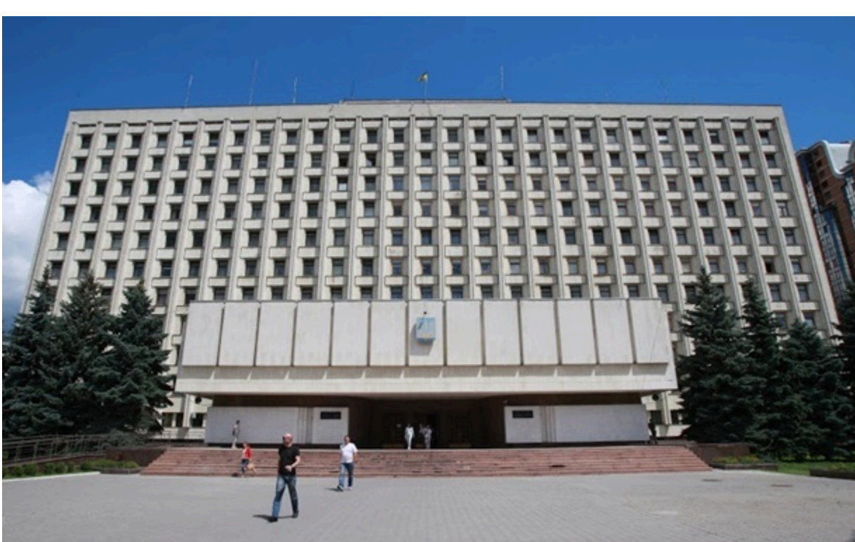
ЦВК зареєструвала 193 кандидатів у народні депутати від Блоку Петра Порошенка

Сьогодні зареєстрували списки кандидатів від партій Блок Петра Порошенка і Солідарність жінок України, а також 19 кандидатів-мажоритарників.