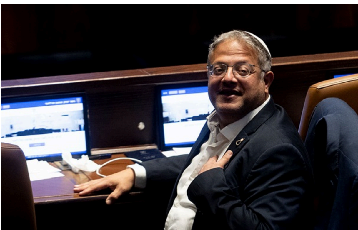
Ітамару Бен-Гвіру на п'ять років заборонили в'їзд у Польщу

Причиною такого рішення стала поведінка ізраїльського урядовця: той насміхався з активістів флотилії Global Sumud. Ізраїльському міністру національної безпеки Ітамару Бен-Гвіру на п'ять років заборонили в'їзд у Польщу. Про це повідомив в соцмережі X глава польського МВС Марчин Кервінський.