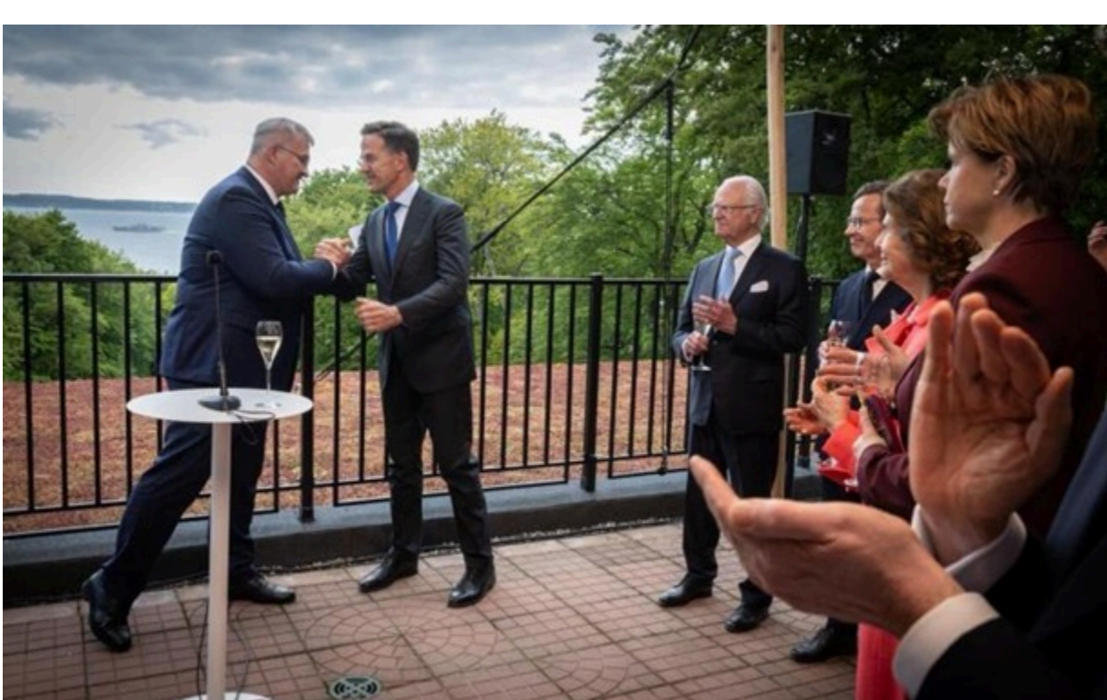
Фото: X / Андрій Сибіга Андрій Сибіга зробив свою заяву під час неформального засідання Ради Україна–НАТО у Гельсінгборзі

"Новий поштовх" необхідний сьогодні в спільних зусиллях заради миру, наголосив голова МЗС України.