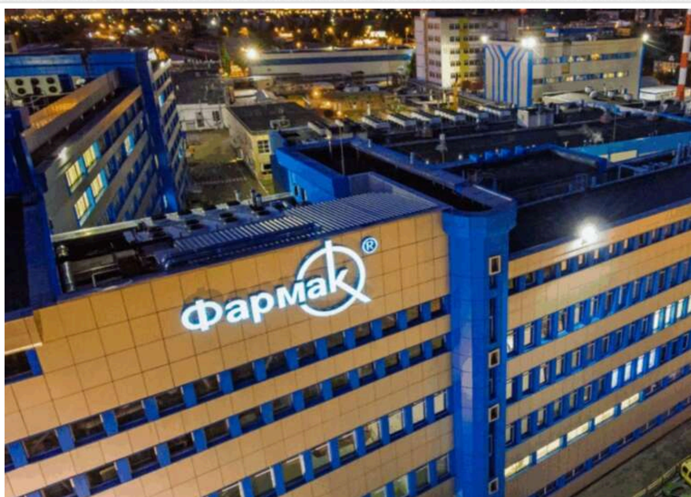
Мільярди на війні та ліки для армії з потрійною націнкою: як «Фармак» заробляє на державних тендерах

В фармацевтичних кулуарах знову розгортається чергова вакханалія – і в епіцентрі опинився виробник ліків Fatmak.