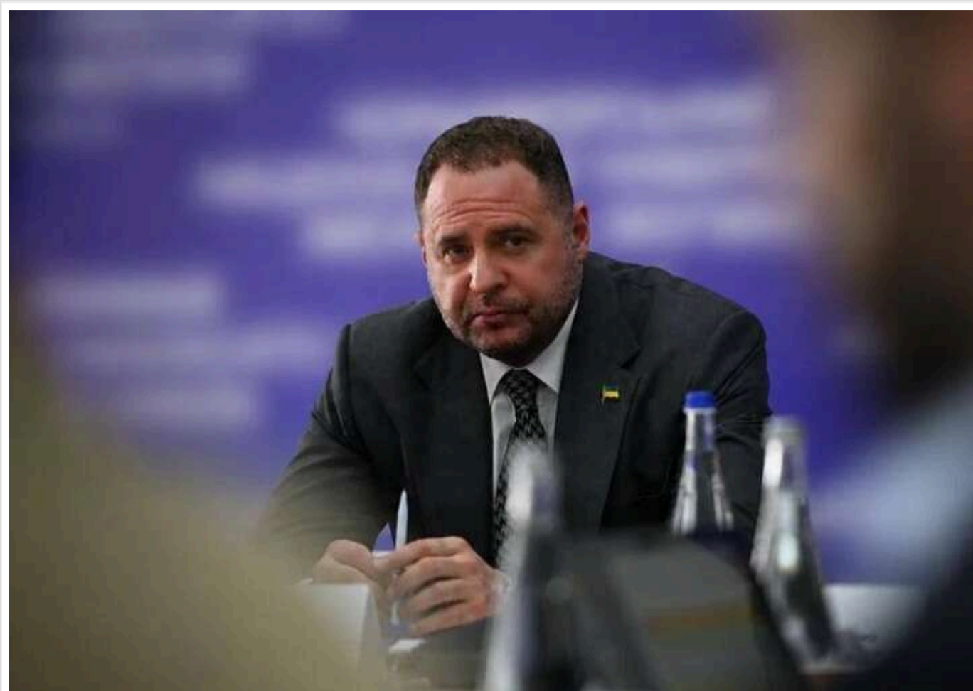
«Підозра є необґрунтованою»: Андрій Єрмак відреагував на рішення Апеляційної палати ВАКС

Апеляційна палата ВАКС розглянула апеляційну скаргу Андрія Єрмака та скаргу прокурора у його справі.