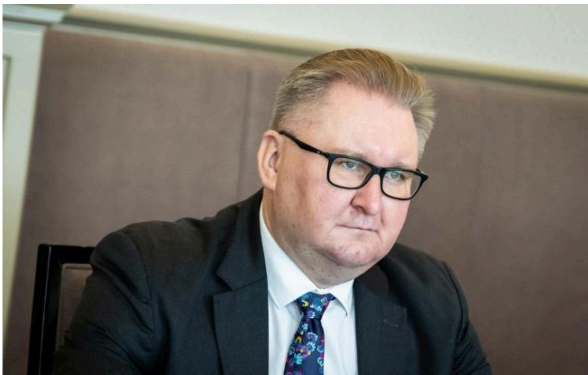
Фото: Віце-прем'єр Тарас Качка (facebook.com)