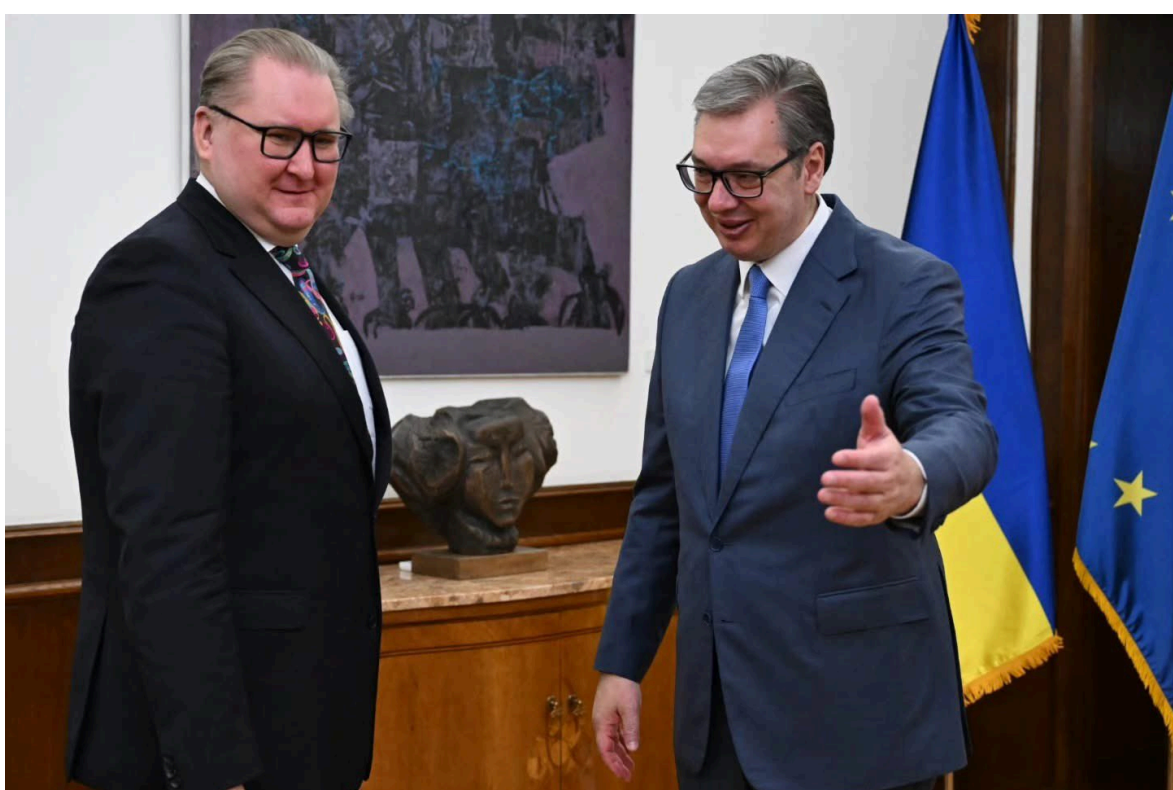
Фото: Президент Сербії Александар Вучич і віцепрем'єр Тарас Качка (x.com/taraskachka)

Також Качка відзначив відкритість Сербії до подальшої активізації двостороннього діалогу.