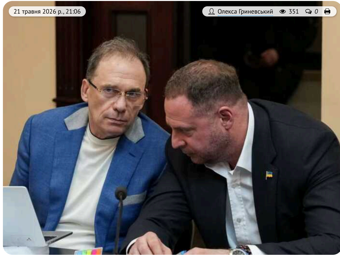
«Ми знаємо наших будівельників»: адвокат Єрмак натягнув, що 200 мільйонів могли вкрати підрядники ЖК «Династія»

«А може, 200 млн вкрали будівельники «Династії»?», – адвокат Єрмак під час апеляції.