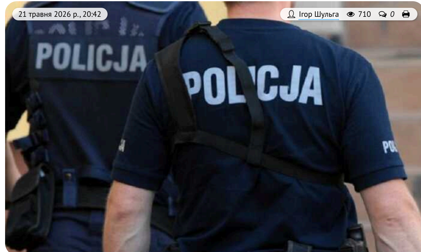
У Польщі затримали трьох чоловіків, яких підозрюють у шпигунстві на користь Росії

12 травня у польському місті Білосток правоохоронці затримали трьох громадян віком 48, 50 та 62 роки. За даними слідства, їх координував громадянин Росії, пов'язаний із ФСБ.