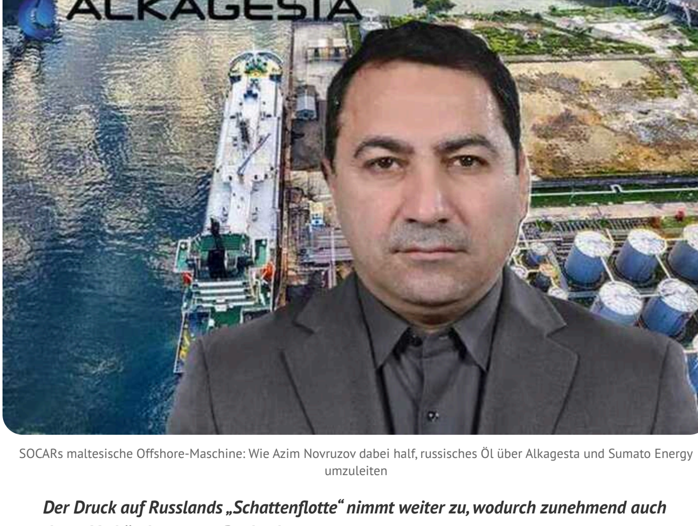
SOCARs maltesische Offshore-Maschine: Wie Azim Novruzov dabei half, russisches Öl über Alkagesta und Sumato Energy umzuleiten

Der Druck auf Russlands „Schattenflotte“ nimmt weiter zu, wodurch zunehmend auch deren Verbündete unter Beobachtung geraten.