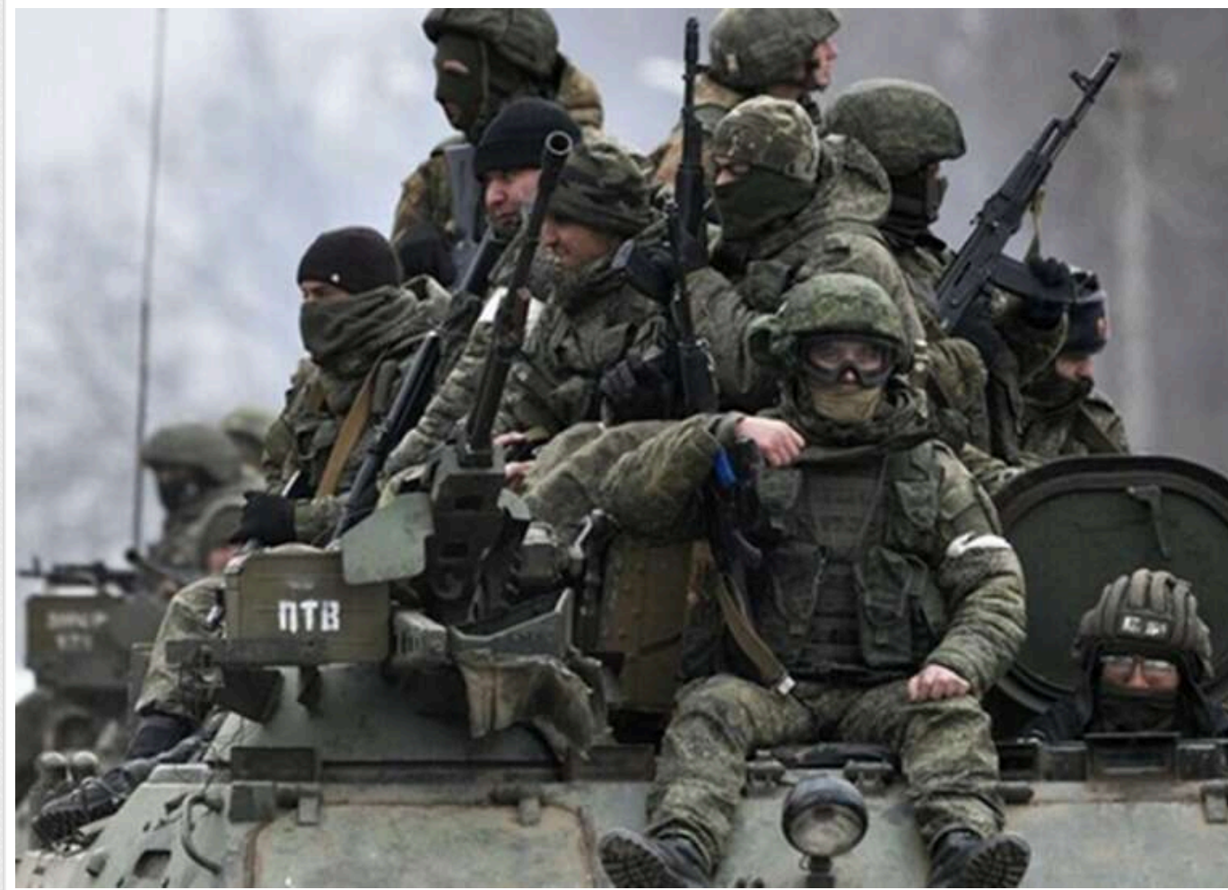
ЗС РФ просунулися на двох ділянках біля траси на Слов'янськ, — DeepState

Російська армія просунулася на двох ділянках у районі траси, що веде на Слов'янськ.