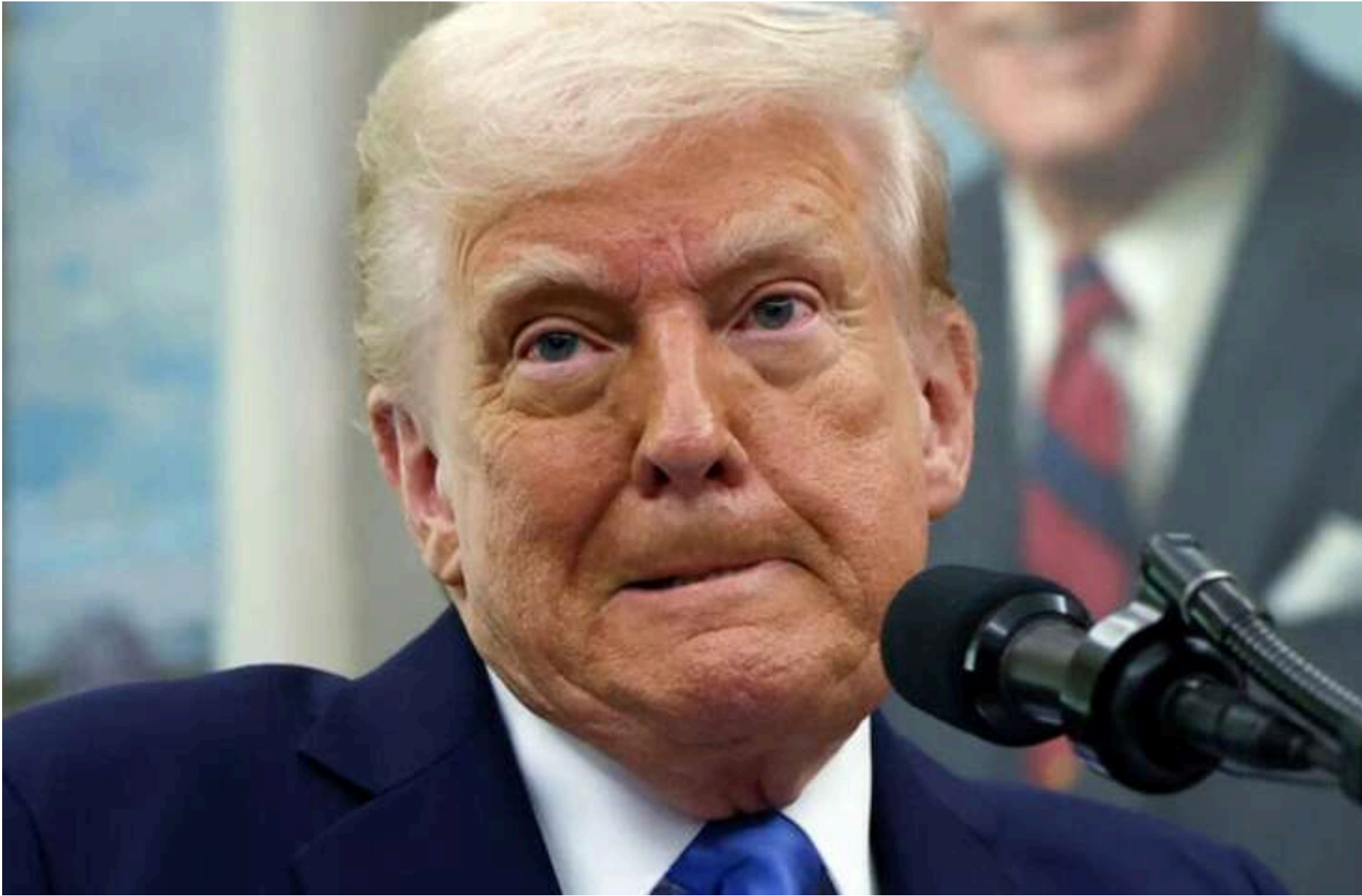
Дональд Трамп.

ЛИСЕНКО КАТЕРИНА — 21 Травня 2026, 08:09 2 Mins Read — СВІТ