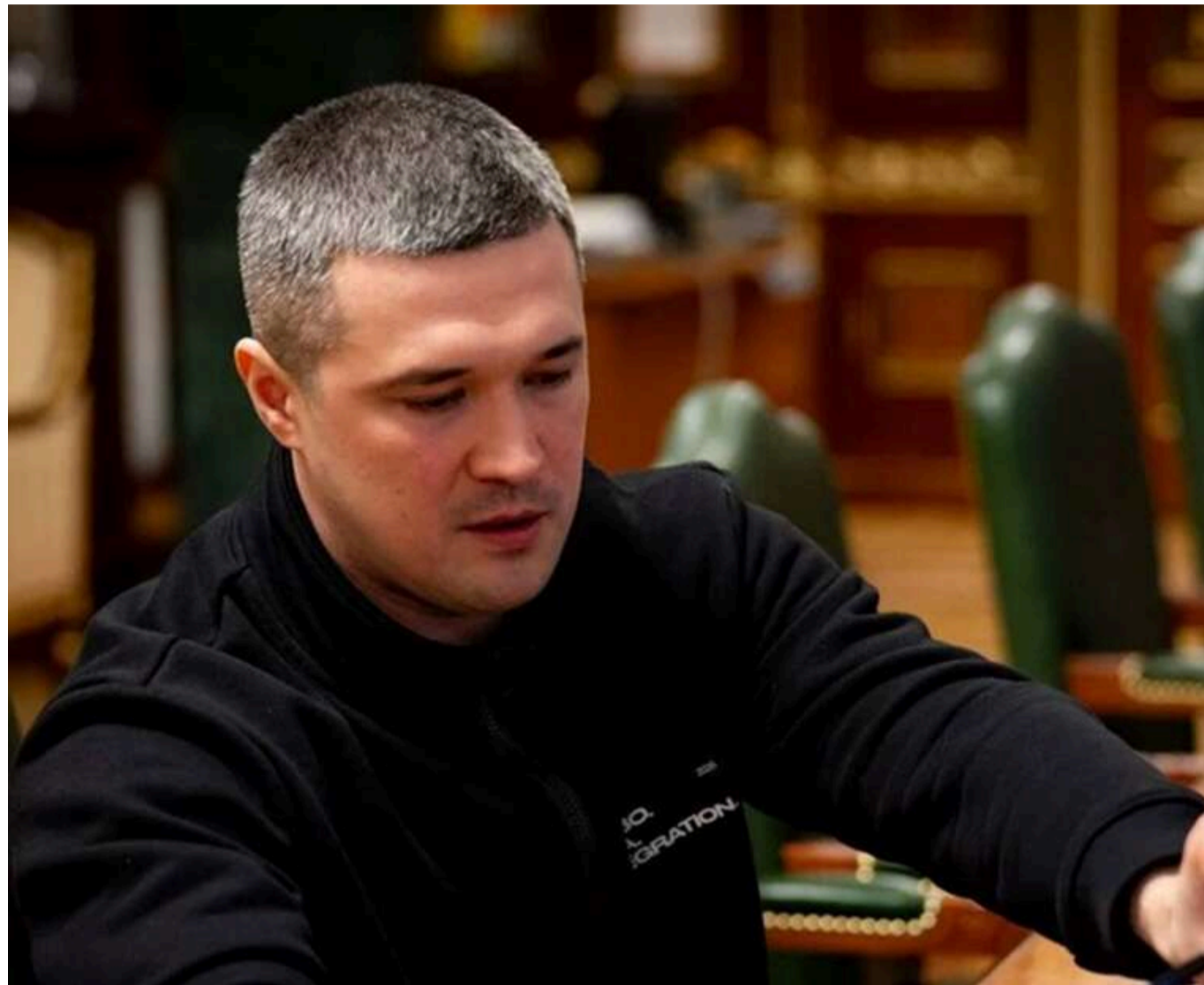
Дешеві ракети проти «шахедів» і реформа рекрутингу: Михайло Федоров назвав головні оборонні пріоритети України

Міністр оборони Михайло Федоров повідомив, що в найближчі місяці Міністерство оборони зосередить зусилля на реформуванні рекрутингу та служби, закупівлях озброєння, а також на забезпеченні бригад дронами.