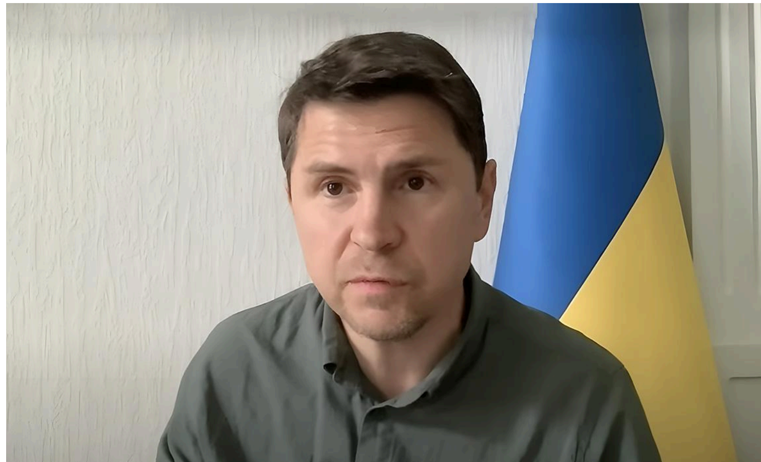
Подоляк додав, що на потенційному північному напрямку працюють Сили оборони України / скріншот з відео

У разі подібних дій з боку цієї країни наша реакція буде миттєвою та максимально жорсткою.