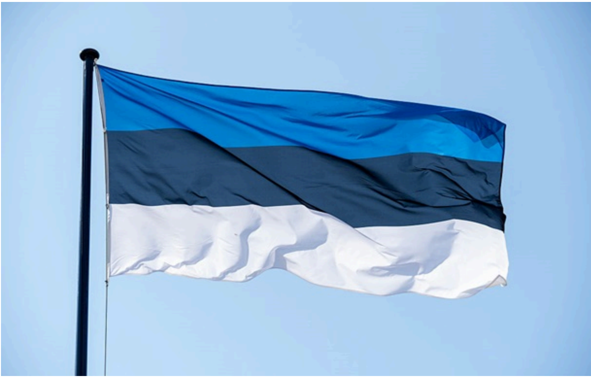
МЗС Естонії викликала російського дипломата

Естонія не дозволяла використовувати свою територію чи повітряний простір для атак на цілі в Росії, акцентували у МЗС країни.