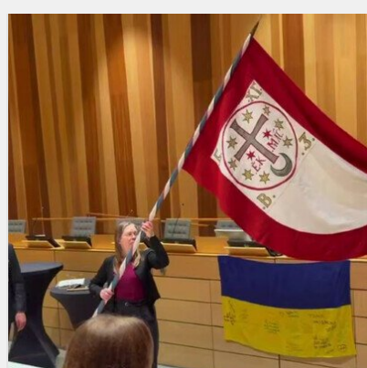
Швеція передала Україні унікальну репліку бойової хоругви ..