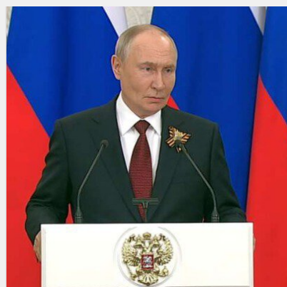
Путін пригрозив одній з країн війною, як в Україні: що ..