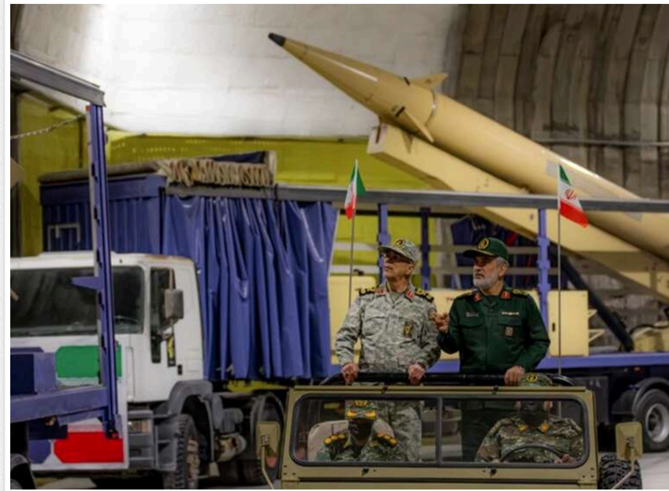
Удари США та Ізраїлю не досягли мети: Іран відновлює військову міць швидше, ніж очікувалося, — CNN

Дані американської розвідки свідчать, що Іран досить швидко відновлює свій потенціал після спільних ударів США та Ізраїлю.