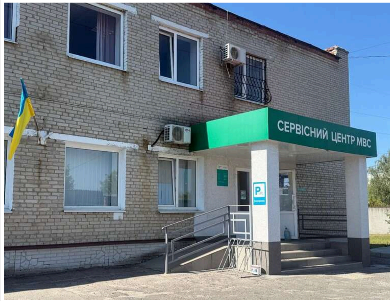
Сховав у декларації 2,5 мільйони: ексчиновник ТЦЦ на Сумщині Махуков відбувся штрафом у 51 тисячу гривень

Колишній адміністратор ТЦЦ МВС № 5943 в Охтирці Сумської області Дмитро Махуков отримав штраф за приховані 2,5 млн гривень у декларації.