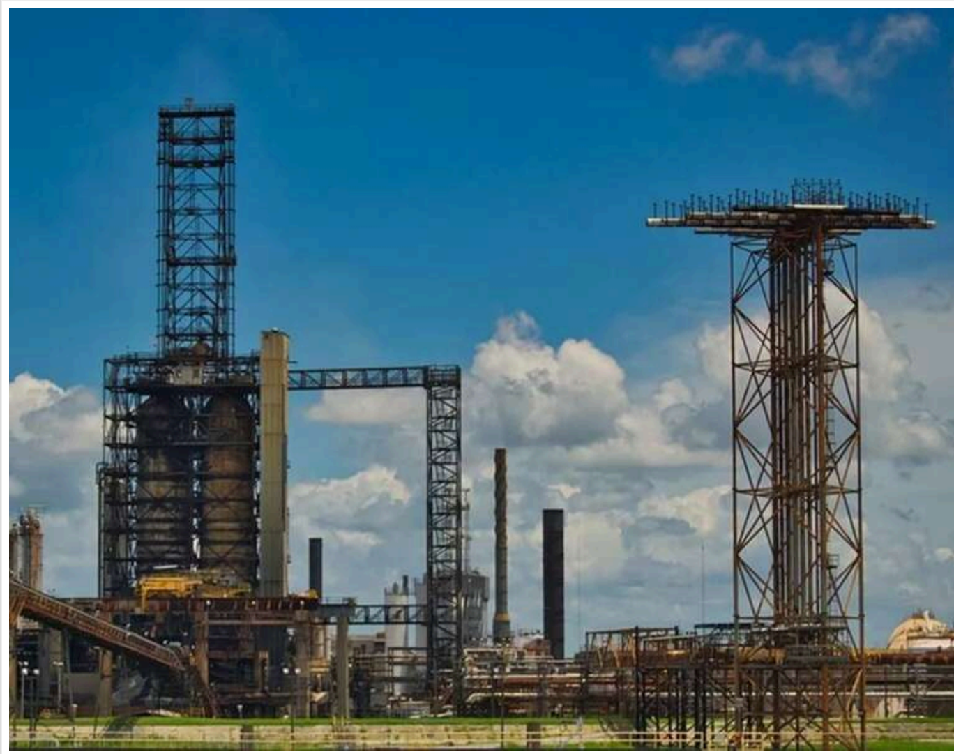
Удари дронів паралізували чверть нафтопереробки РФ: зупинено заводи на 83 мільйони тонн, – Reuters

Після серії ударів українських безпілотників останніми днями майже всі великі нафтопереробні заводи в центральних регіонах Росії змушені були зупинити або суттєво скоротити випуск палива.