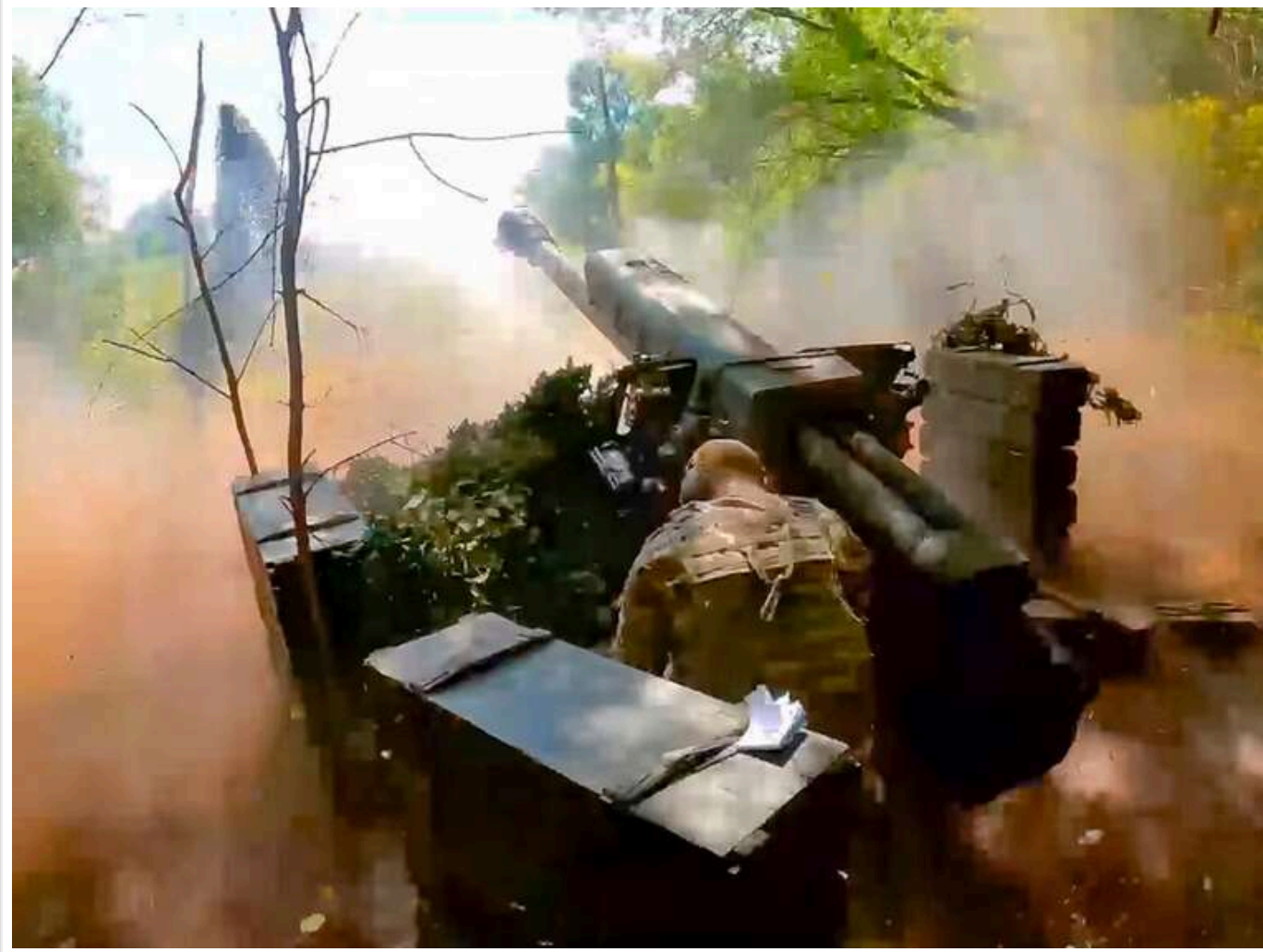
Ситуація на фронті: Зафіксовано 76 боєзіткнень, ворог 24 рази атакував на Покровському напрямку

Від початку доби на фронті зафіксовано 76 атак з боку агресора.