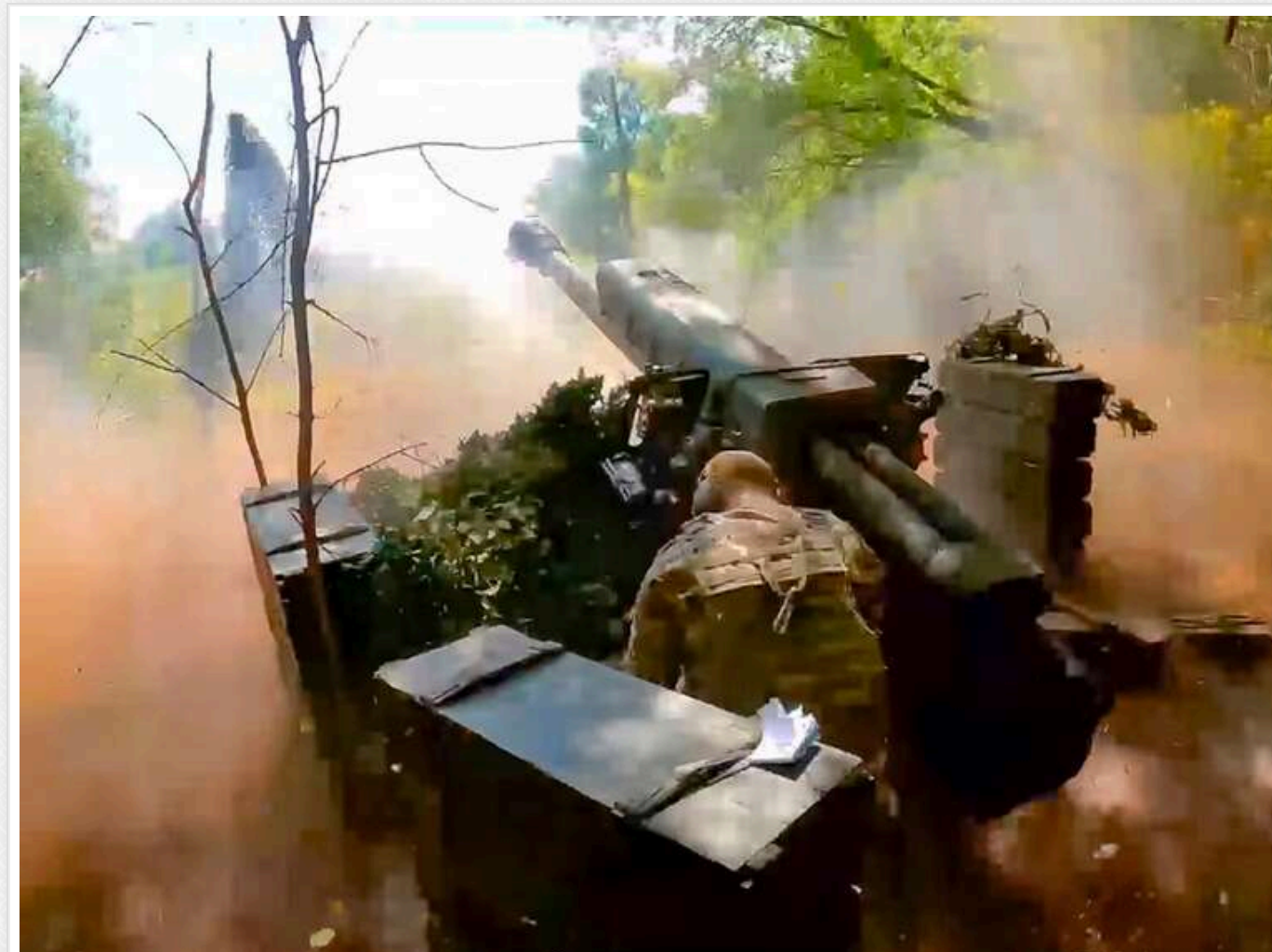
Ситуація на фронті: Зафіксовано 76 боєзіткнень, ворог 24 рази атакував на Покровському напрямку

Від початку доби на фронті зафіксовано 76 атак з боку агресора.