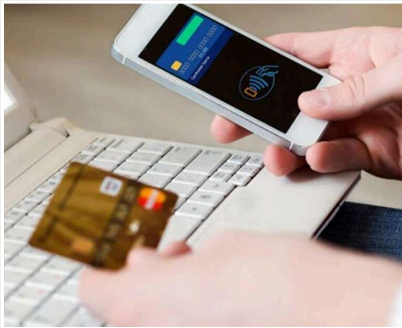
ШІ на службі аферистів: збитки українців від технологічного шахрайства сягнули 1,4 мільярда

За перші п'ять місяців 2026 року фінансове шахрайство в Україні, особливо операції з банківськими рахунками, стало помітно технологічнішим і більш адресним. Зловмисники дедалі активніше застосовують штучний інтелект для генерації фейкових дзвінків, листів, підроблених веб-ресурсів і шахрайських пропозицій, які стає все складніше відрізнити від автентичних.