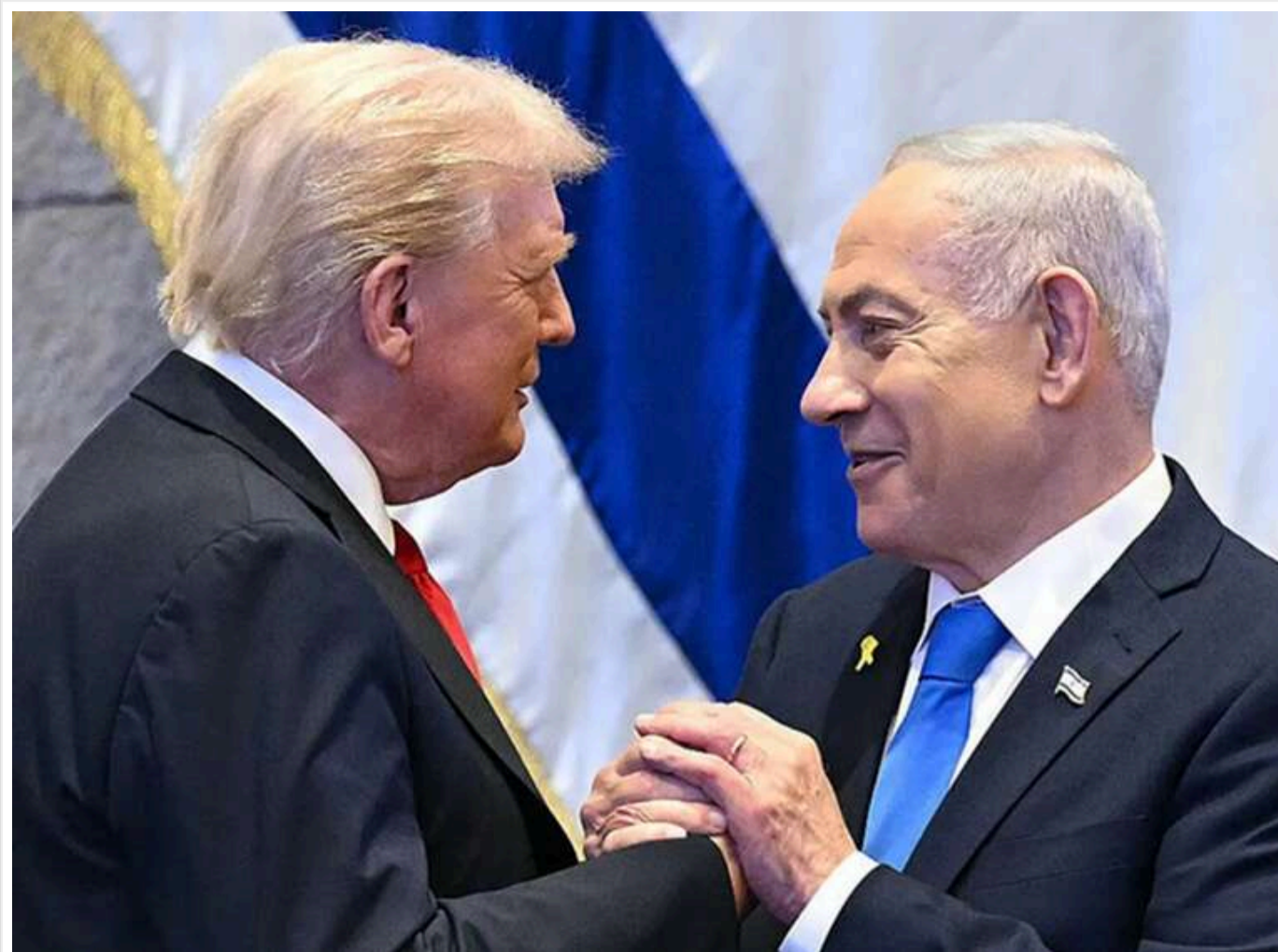
«Затримка атак є помилкою»: Нетаньягу вимагає від Трампа відновлення ударів по Тегерану, — CNN

Президент США Дональд Трамп провів телефонну розмову з прем'єр-міністром Ізраїлю Біньяміном Нетаньягу, під час якої обговорювали подальші кроки щодо конфлікту з Іраном. Переговори виявилися досить напруженими, адже сторони продемонстрували різні погляди на те, як варто діяти в умовах війни на близькому Сході.