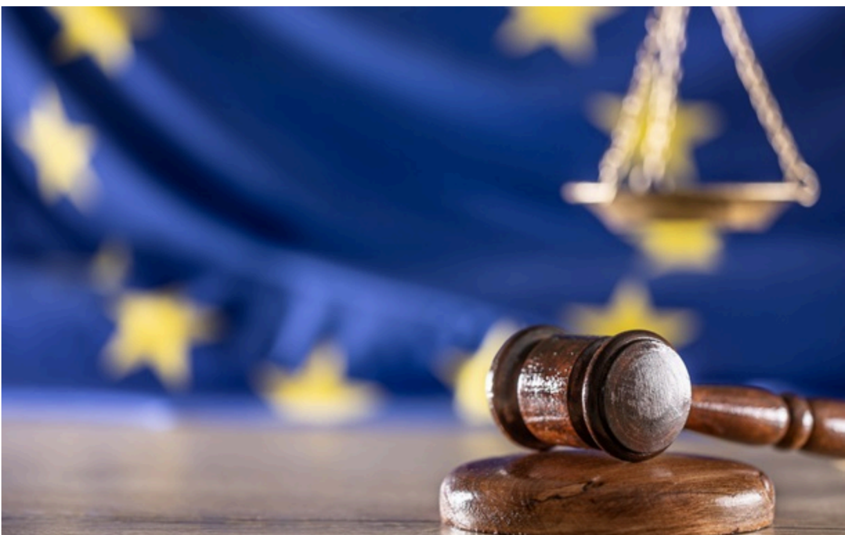
Суд у ЄС розширив тлумачення "контролю" над активами росіян

Відтепер активи можна розглядати як такі, що належать засновнику чи бенефіціару трасту, якщо ці особи мають повноваження розпоряджатися активами або мати вплив на них та рішення, прийняті довірчою особою щодо них.