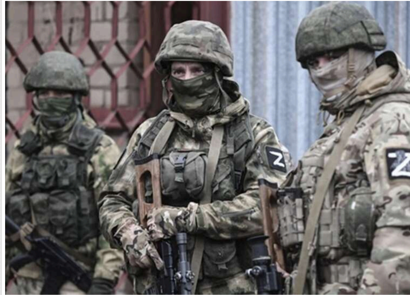
Пастка у газопроводі: окупант розповів про ліквідацію понад 700 військових РФ під час спроби штурму Суджі

У Росії вперше розповіли про перебіг операції ЗС РФ у Суджі Курської області. Просуваючись магістральним газопроводом, російські солдати помирали, навіть не виходячи назовні з її іншого краю, тому доводилося фактично переступати через трупи.