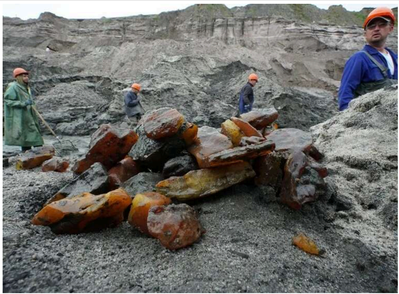
«Бурштинова мафія 2.0»: як під виглядом наукових досліджень в Україні легалізували мільярдні схеми вимивання каміння

Бурштинова мафія 2.0. Як під час війни еволюціонував схемний видобуток «сонячного каменю».