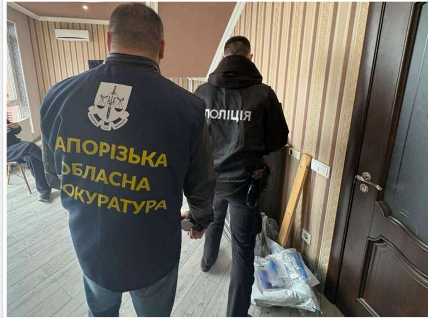
Збирали гроші на «подарунки перевірки»: у Запоріжжі судитимуть фейкових податківців, які ошукали бізнес на 700 тисяч гривень

Прокуратура скерувала до суду обвинувальний акт щодо трьох запорожців, які представлялися співробітниками місцевої податкової і ошукали бізнесменів на 700 тисяч гривень.