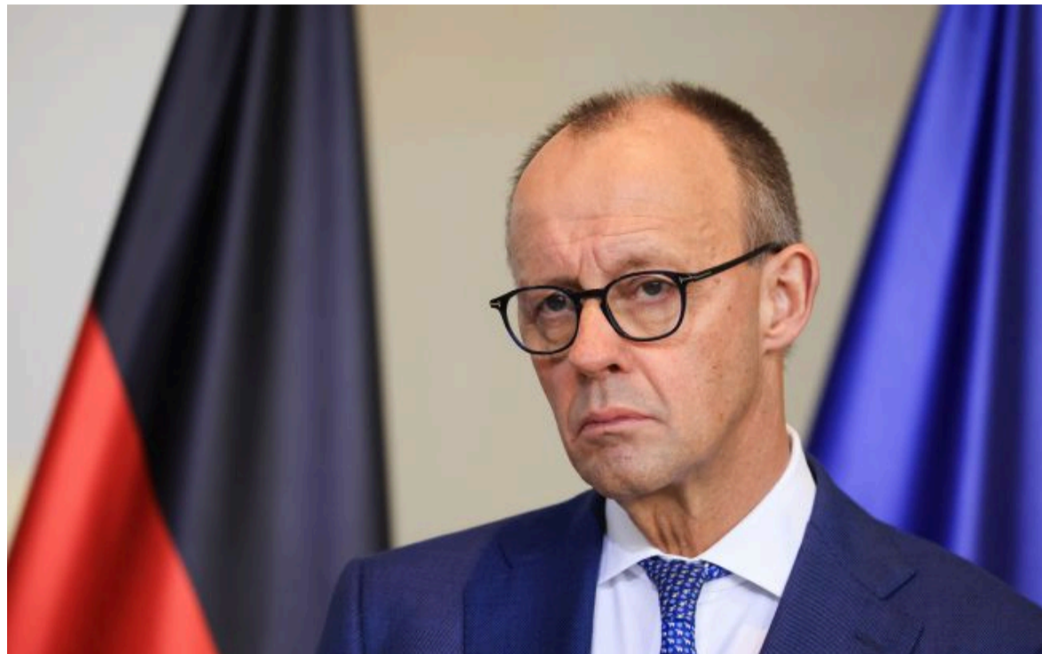
Фрідріх Мерц, канцлер Німеччини