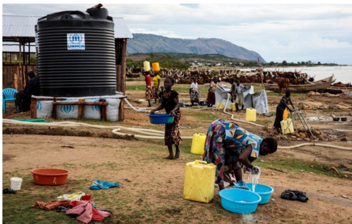
Фото: українців закликали утриматись від поїздки у ДР Конго