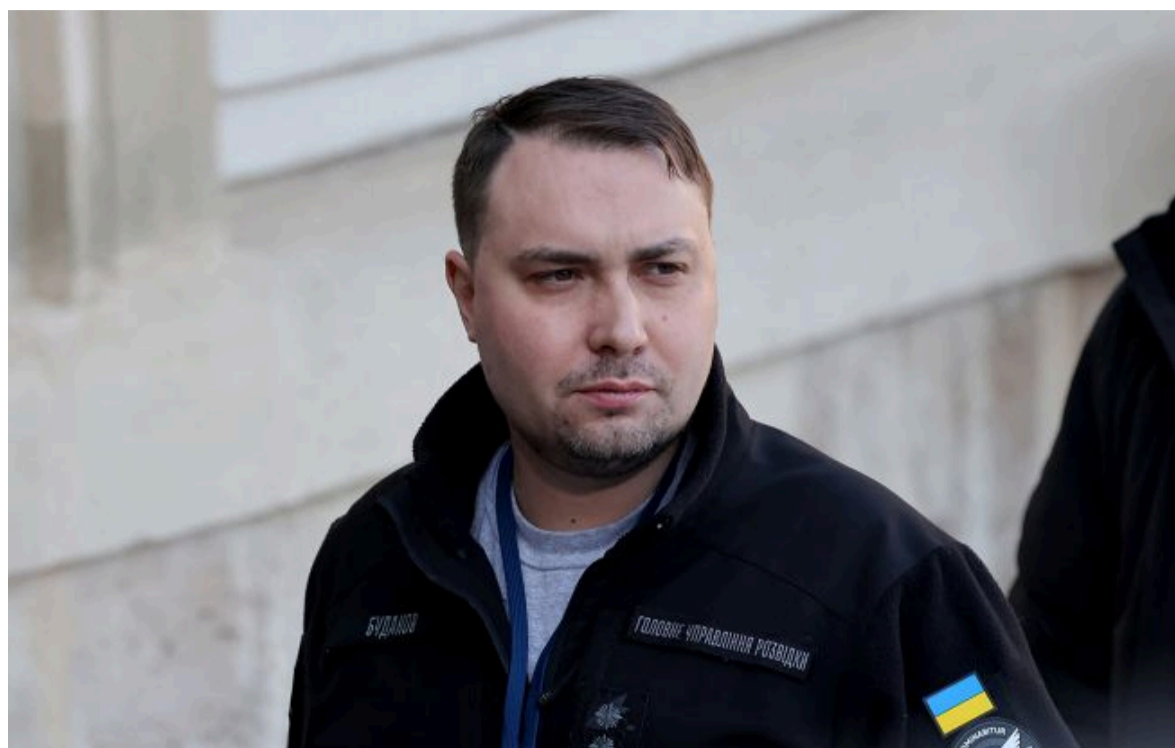
Фото: керівник Офісу президента Кирило Буданов

Розумій ситуацію на фронті через факти, а не чутки з РБК-Україна у Google