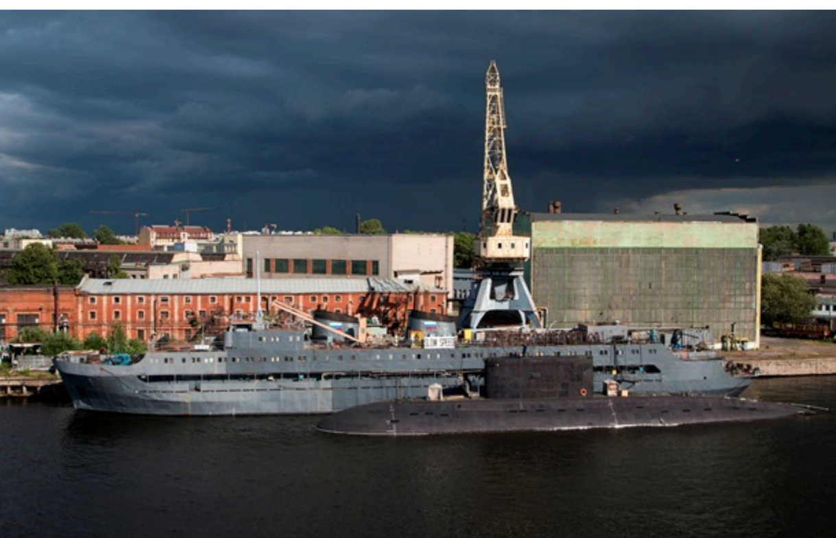
Російський проєкт Скіфи викликав занепокоєння розвідки НАТО

Пускові установки на морському дні створили б серйозну проблему для НАТО у разі війни, оскільки їх буде складно виявити та вразити.