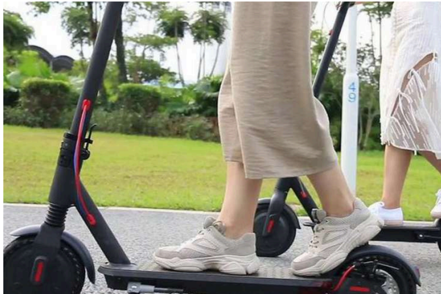
Ілюстративне фото з відкритих джерел

В Україні водії електросамокатів офіційно визнані повноцінними учасниками дорожнього руху, а самі електросамокати – джерелом підвищеної небезпеки.