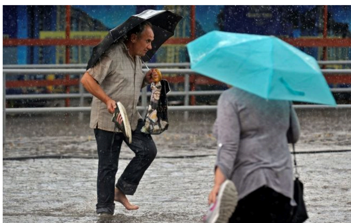
Травневі опаді можуть "накрити" раптово

Стихія не застане зненацька! Слідкуй за змінами погоди з РБК-Україна у Google