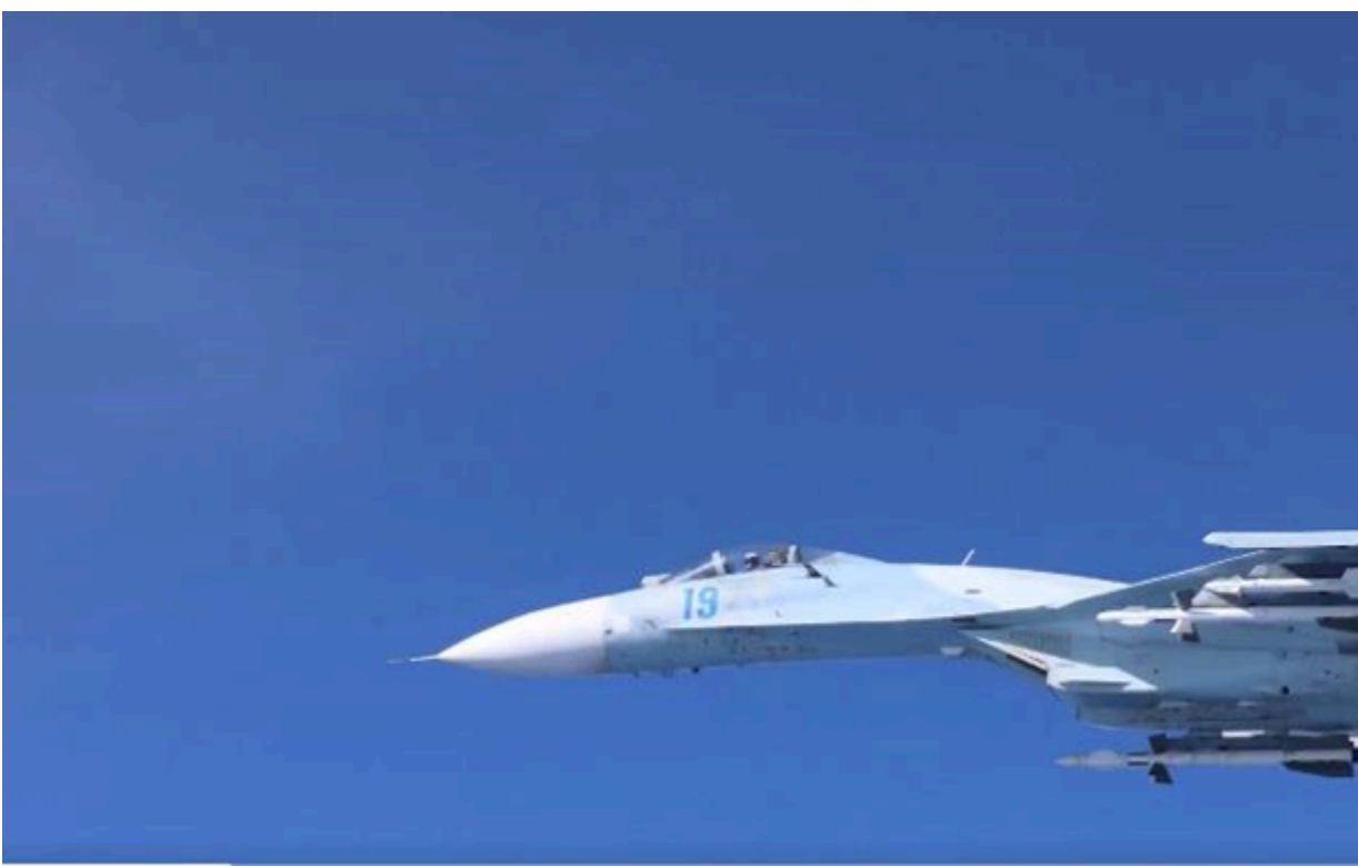
Російські літаки пролетіли лише в шести метрах від британського літака

Британський літак виконував плановий політ на підтримку операцій НАТО, сприяючи безпеці східного флангу Альянсу. Міноборони Британії ввечері 20 травня повідомило , що Росія перехопила його літак-розвідник над Чорним морем.