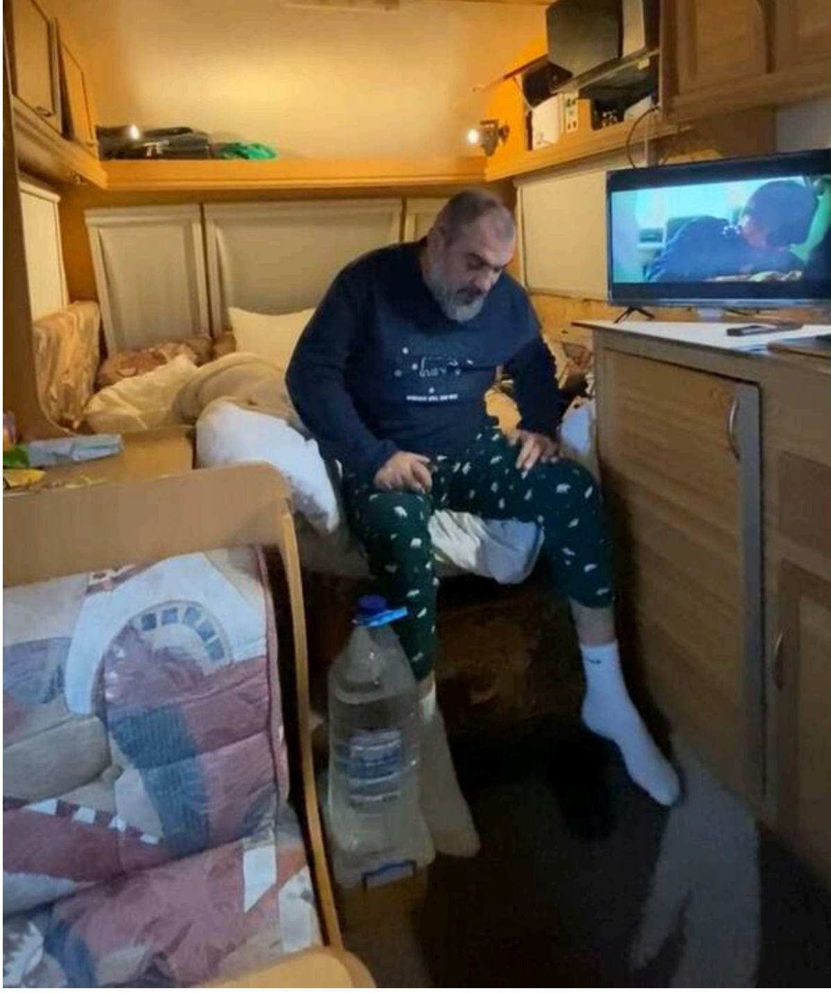
Кримінальний авторитет з Одеси "Джавид" повертає собі через суд українське громадянство

Відповідне рішення ухвалив 15 травня 2026 року суддя Дмитро Василяк.