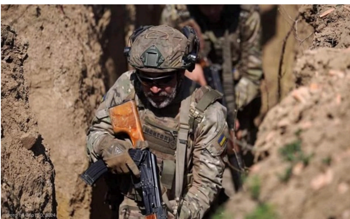
Фото: 114 Окре ТРО ЗСУ мають тактичні успіхи на низці напрямків

У квітні Росія втрачала 179 військових за кожен захоплений квадратний кілометр української землі, зазначив міністр оборони.