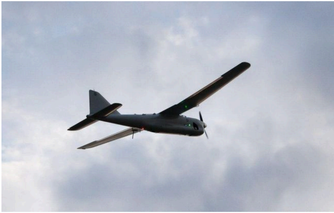
Фото: Латвія третій день оголошує повітряну тривогу (Getty Images)